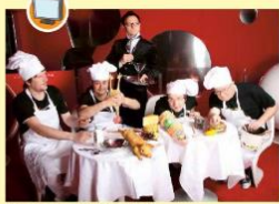
Glasbena skupina SToP

Odpadna embalaža lahko postane odlični instrument. Potrebujemo samo malo domišljije in pridne roke.