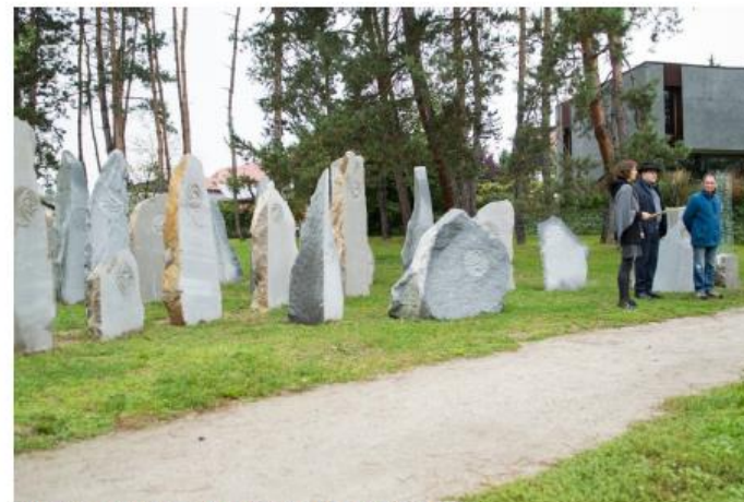
Otvoritev Geopunkturnega kroga v Mestnem parku v Mariboru, 2017.

RAZMISLI. KJE SO VZROKI, DA SE GAJA NE POČUTI NAJBOLIE? ONESNAŽEVANJE NARAVE JI VERJETNO RES NE DANE PRAV DOBRO? SE DOGAJA ŠE KAJ TAKŠNEGA, KAR BI LAHKO SLABO VPLIVALO NA NJENO POČUTJE?