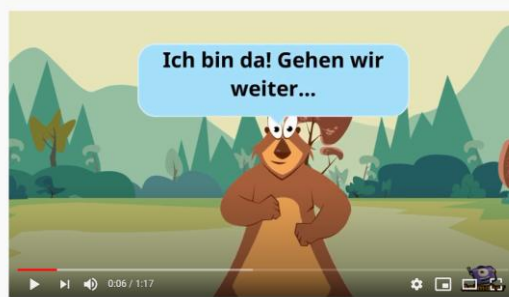
die Körperteile der Tiere 2/2

OPOMBA: Opazil boš, da v videoposnetkih deli telesa niso zapisani s preglasom. Pravilen zapis je s preglasom, zato upoštevaj naslednje pri zapisu v zvezek: ae – ä, oe – ö, ue - ü