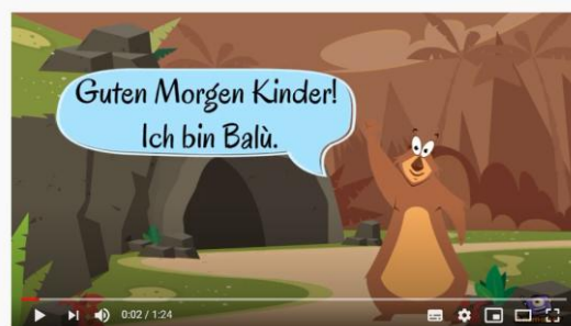
die Körperteile der Tiere 1/2

PRIMER: die Zunge – jezik, der Stoßzahn - okel