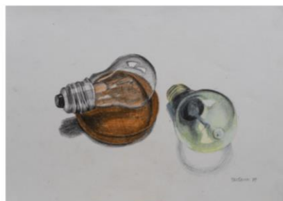
Ida Brišnik Remec, Žarnici, 1971, risba z barv. svinčniki, inv. 1657