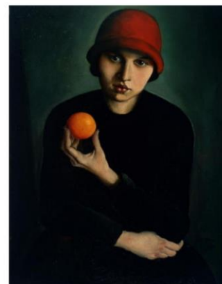
Ivan Kos, Deklica z oranžo, 1927, olje na platnu

TIHOŽITNI PREDMET JE LAHKO TUDI DEL DRUGEGA MOTIVA – NA PRIMER PORTRETA.