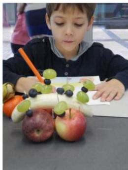
Otroške ustvarjalnice v UGM

PRIPRIVI POSTAVITEV ENEGA ALI VEČ PREDMETOV. MORDA IZBEREŠ KAKŠEN SVOJ NAJLJUBŠI PREDMET ALI SADJE, KI TI JI BARVNO ZANIMIVO. RAZMISLI, KAKŠNO BI BILO OZADJE OZIROMA PROSTOR, V KATEREGA BOŠ NAMESTIL SVOJE TIHOŽITJE.