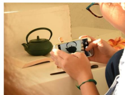
Otroške ustvarjalnice v UGM

TIHOŽITEJE LAHKO NARIŠEŠ, NASLIKAŠ, FOTOGRAFIRAŠ ALI CELO POSNAMEŠ. SVOJE IZDELKE NAM POŠLJI NA NASLOV: INFO@UGM.SI