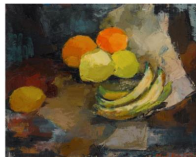
Olaf Globočnik, Banane, 1960, olje na platnu, 42 x 33 cm

BANANA JE TIHO. TUDI LIMONA SE NE OGLASA, PRAV TAKO POMARANČA. JA, TO JE TIHOŽITJE.